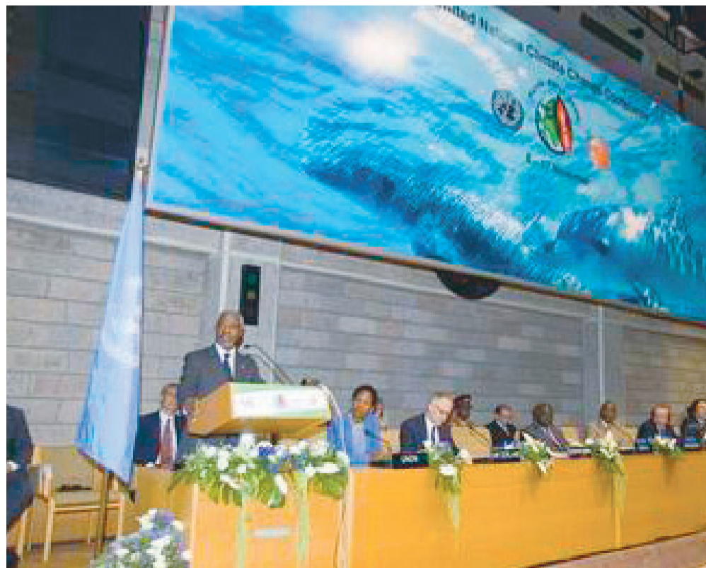
På FN's klimakonference i Nairobi deltog FN's generalsekretær Kofi Annan, Kenyas præsident, den schweiziske præsident, adskillige afrikanske statsledere samt miljøministre og mange tusinde deltagere fra hele verden. Konferencen i 2009 forventes at blive betydeligt større, da der formentlig vil stå mere på spil. De årlige klimakonferencer er nogle af de største FN-konferencer. I Montréal sidste år deltog i alt ca. 13.000 mennesker

- Klimaudfordringen er en af de største udfordringer, vi mennesker står over for i dette århundrede. Det er en global udfordring, der kræver global handling og politisk lederskab. Med tilbuddet om, at Danmark kan påtage sig værtskabet for en klimakonference, der kan gå hen og blive afgørende for den fremtidige globale indsats, viser regeringen, at Danmark er villig til at påtage sig en meget stor rolle i de kommende års internationale forhandlinger, sagde miljøminister Connie Hedegaard efter at have udstedt invitationen.