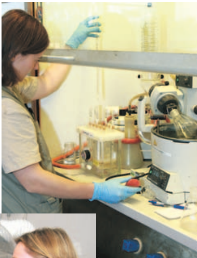
Lantmännen Analycen analyserer det, man kalder fra jord til bord, hvilket er næsten alt fra jord, vand og luft.