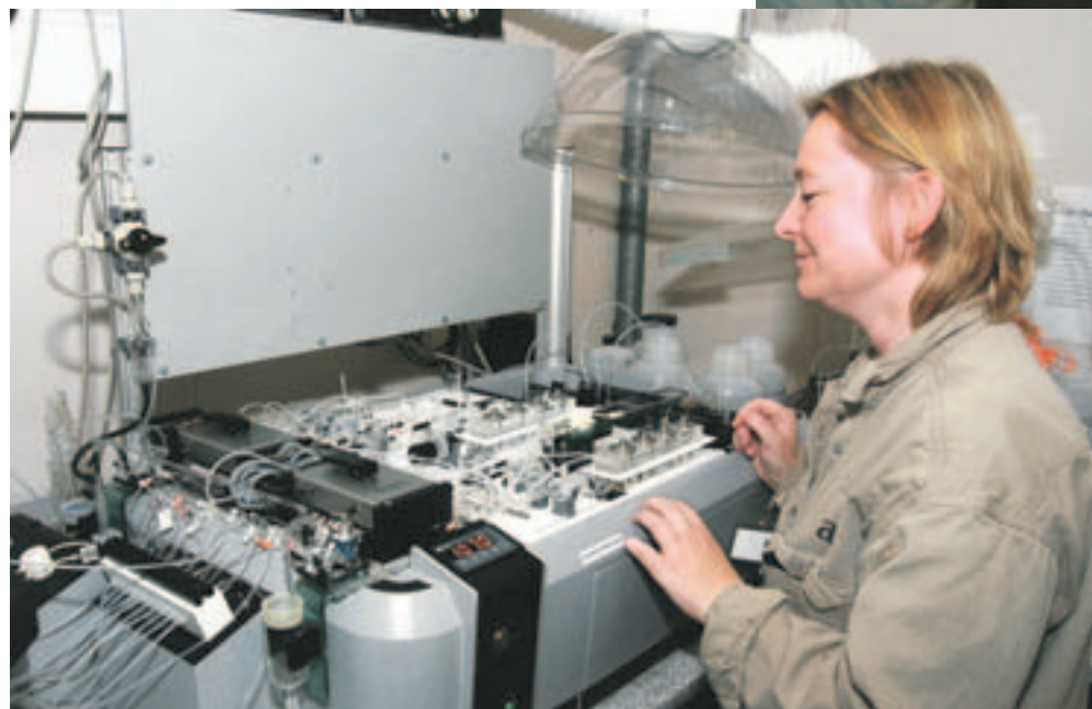
Analyselaboratorierne kan ofte levere analyseresultater fra dag til dag, og har de mest moderne metoder til rådighed..

- Vi er glade for også at blive valgt som samarbejdspartner på de lidt mere specielle opgaver. Vi har for eksempel netop været med på analysearbejdet fra Kærgaard Plantage i Region Syddanmark, hvor der efterhånden har tegnet sig et billede af en meget omfattende