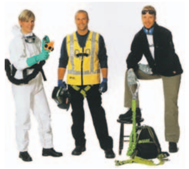
Produkterne fra Sperian dækker meget bredt

2001 ved en sammenlægning af to franske virksomheder, som begge var førende inden for personligt sikkerhedsudstyr. Selv om det således er en ung virksomhed, som nu har skiftet navn til Sperian Protection, har den en lang historie.