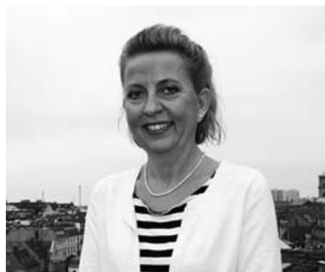
På vores hoteller møder man medarbejdere, der trives med at arbejde med det, som de tror på. Man vil se, hvordan vi sammen forvandler de miljø- og samfundsmæssige spørgsmål til naturlige hverdagshandlinger. Du får indblik i en verden, hvor samfundet rundt omkring os er en ressource.