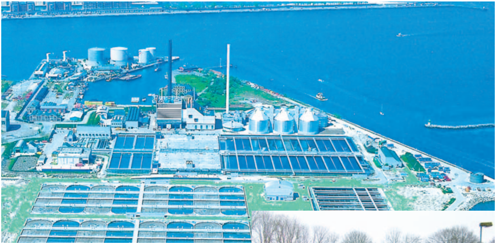
Indenfor miljøområdet har Logimatic oparbejdet stor erfaring med vores automationsløsninger til renselanlæg